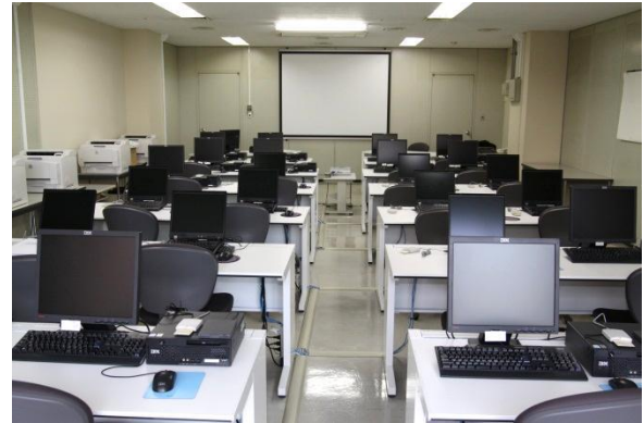
端末研修室 (管理経済)